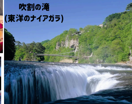
吹割の滝 (東洋のナイアガラ)